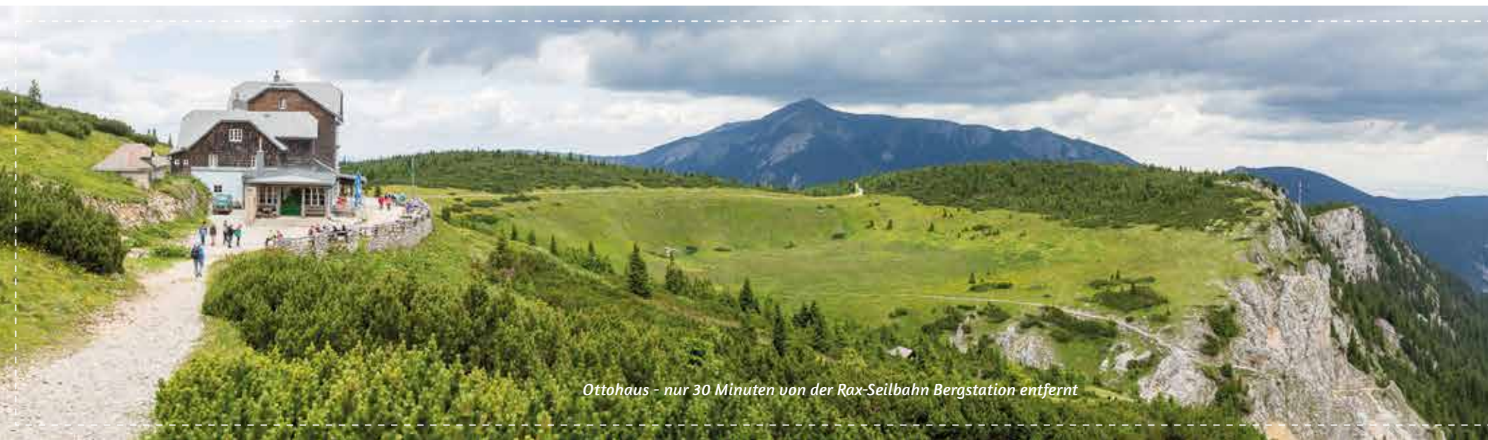
Ottohaus - nur 30 Minuten von der Rax-Seilbahn Bergstation entfernt